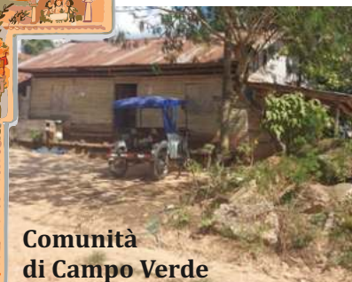
Comunità di Campo Verde Pucallpa (Perù)

Ogni sera di Quaresima, dal 21 febbraio alle ore 20,32, tre minuti per pregare in famiglia con il nostro arcivescovo monsignor Delpini