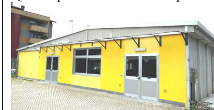
continua a pagina 3

Parrocchia: 02.6120657 - www.santeusebio.org / santeusebio.cinisello@gmail.com