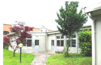
continua a pagina 2

Mancherebbe circa il 18% da pagare. Siamo a buon punto... ma è importante cancellare il debito entro fine anno. È necessario che tutti noi ci sentiamo responsabili di raggiungere questa meta. La Parrocchia siamo noi e dobbiamo sentirci parte di questa comunità offrendo il nostro servizio volon-